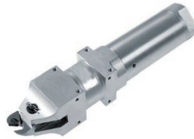
Schneidzange GT-NS20 mit Druckverstärker