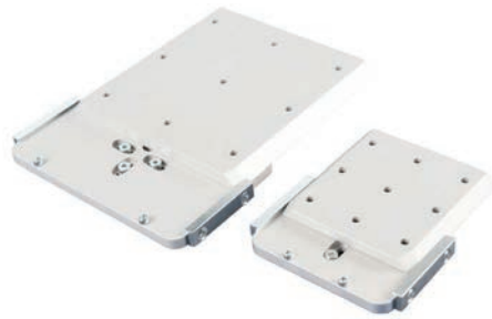
Wandhalter mit Grundplatte